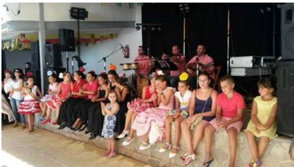
El Grupo “ Se lió el Tangai” no dejó de animar en toda la tarde, merecen más de un aplauso.