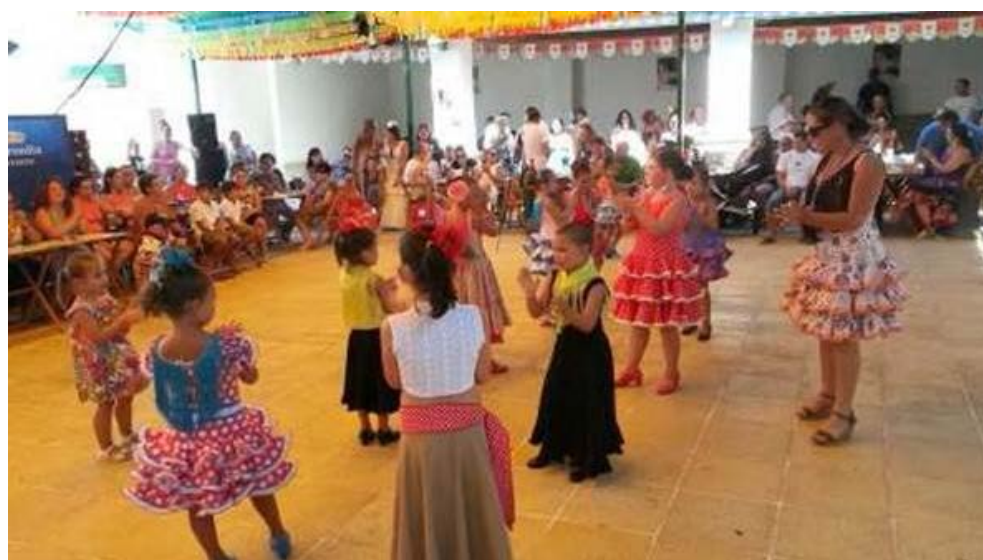
Las más pequeñas bailan para el concurso.