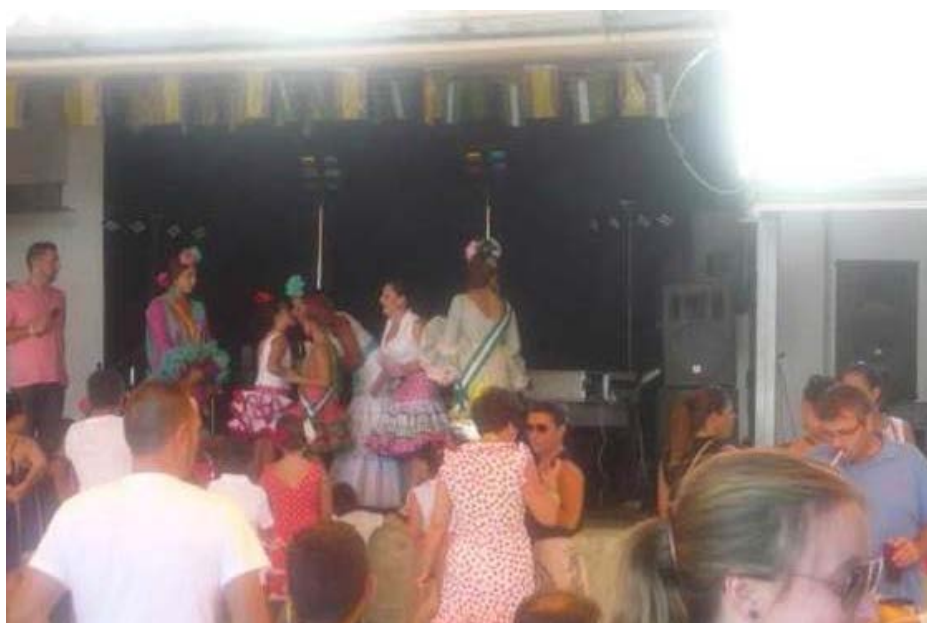
Llegó la hora de entregar los premios.