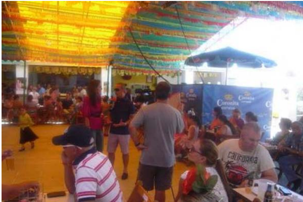
Nuestro alcalde Andrés Trujillo, explica el trabajo de la feria, anima y agradece la asistencia y colaboración de todos.