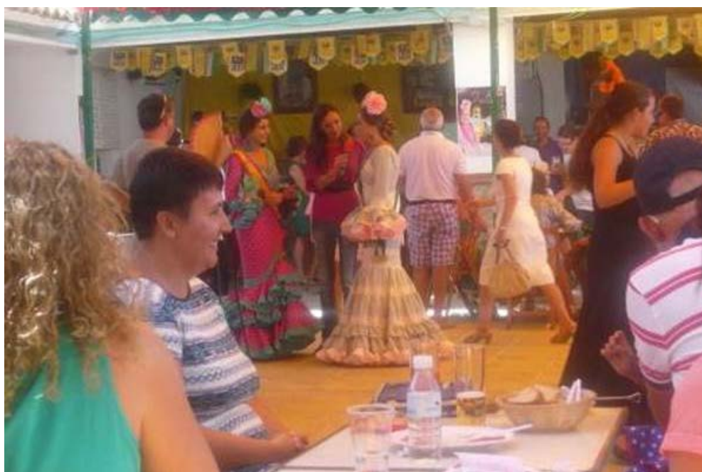
Televisión Tarifa recogía imágenes y comentarios.