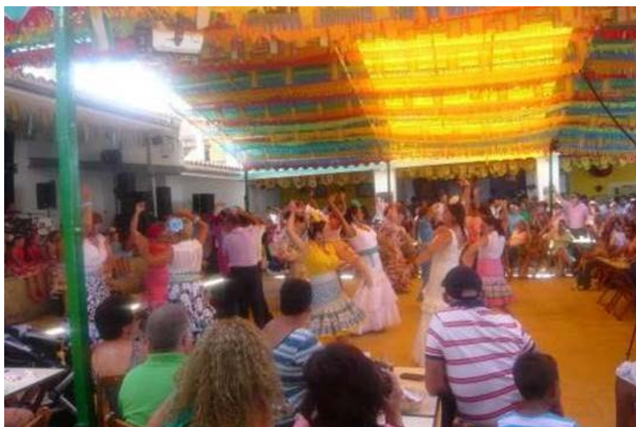
El concurso de mayores tuvo mucha participación.