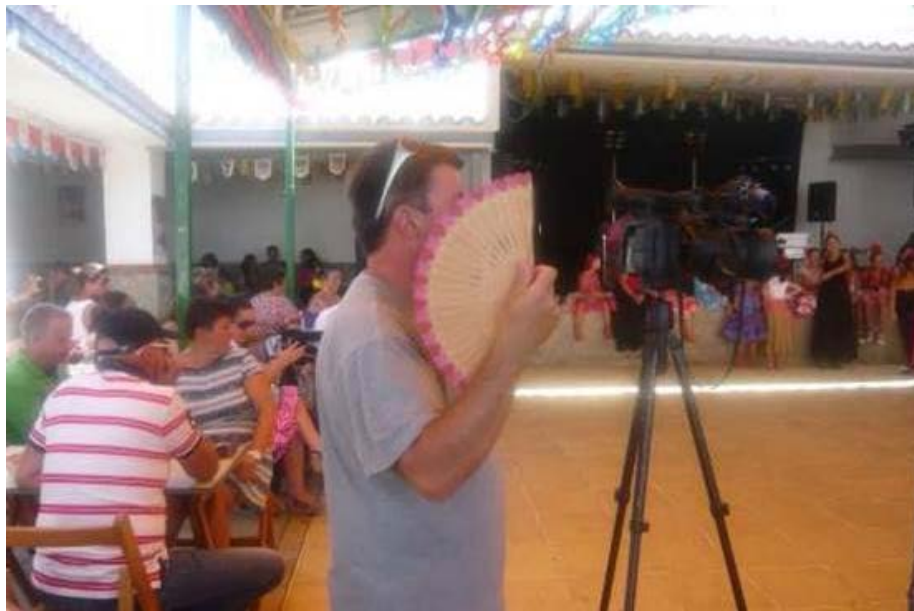
El calor obligaba a abanicarse.